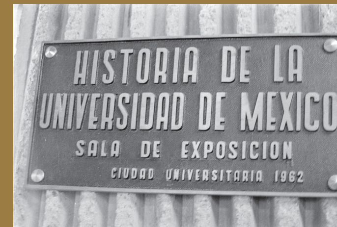
Foto: Placa de la exposición permanente "Historia de la Universidad de México". Reportaje gráfico sobre el Archivo Histórico de la UNAM.